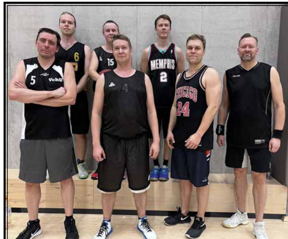
KOPS = Koripalloseura